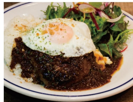
オリジナルロコモコ 1,380 粗びきでジューシーなハンバーグをスモークロコモコです