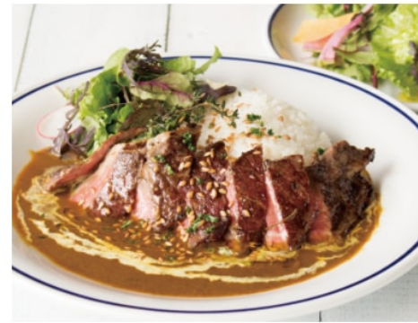
湘南ステーキカレー 1,480 厚切りステーキを豪快にのせたプレミアムカレーです