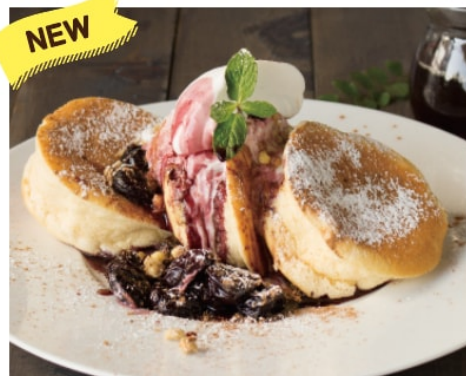
NEW アメリカンチェリー パンケーキ 1,380