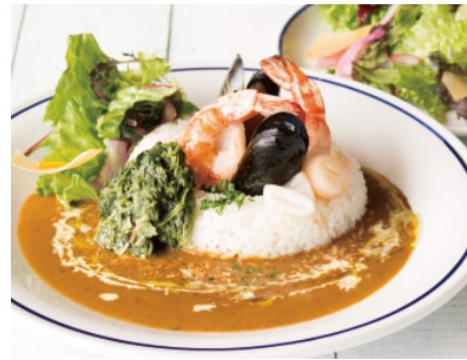
湘南シーフードカレー 1,380 湘南パンケーキのシグニチャーカレー フルティ&スパシーで豊かなコクが特徴です