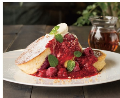
ラズベリーソース パンケーキ 1,380