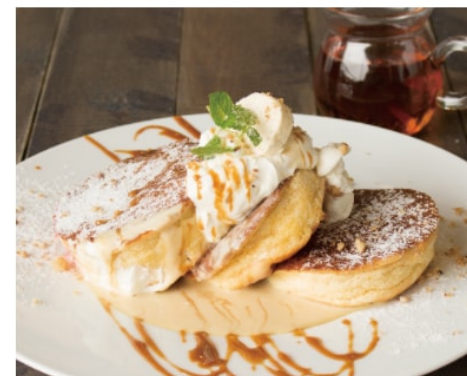
ロイヤルミルクティー パンケーキ 1,280