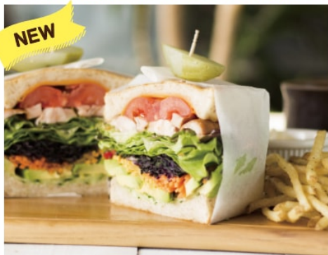
ベジ&チキンサンドイッチ 1,180