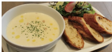
湘南クラムチャウダー 980