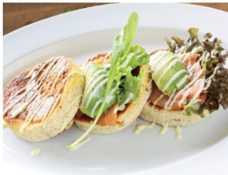
スモークサーモン&アボカド ディジョンマヨネーズ 1,480