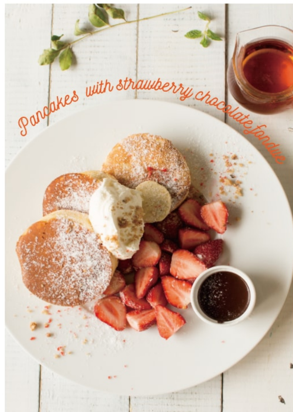
苺のチョコフォンデュ パンケーキ 1,880 <フルーツ 1/2> 1,380