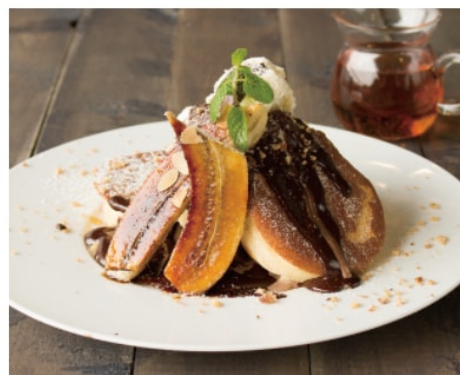
バナナ&ホットチョコレートの パンケーキ 1,280