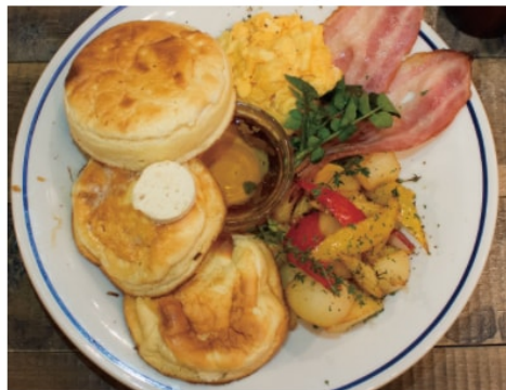
オールデイズブレックファースト 1,380 全時間帯で楽しめる朝食系パンケーキプレート