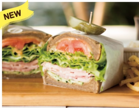
ベジ&ハムサンドイッチ 1,080

ボリューム満点のグルメサンドイッチ！パンは辻堂のローカルベーカリー Lippé を使用しております。