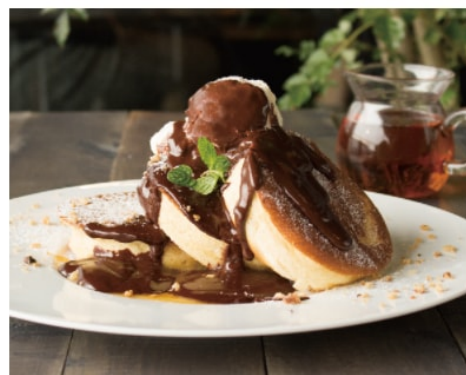
ホットチョコレート パンケーキ 1,180