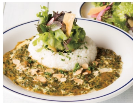
湘南ほうれん草カレー 980 ほうれん草約1束分を使用した数分たっぷりのカレーです